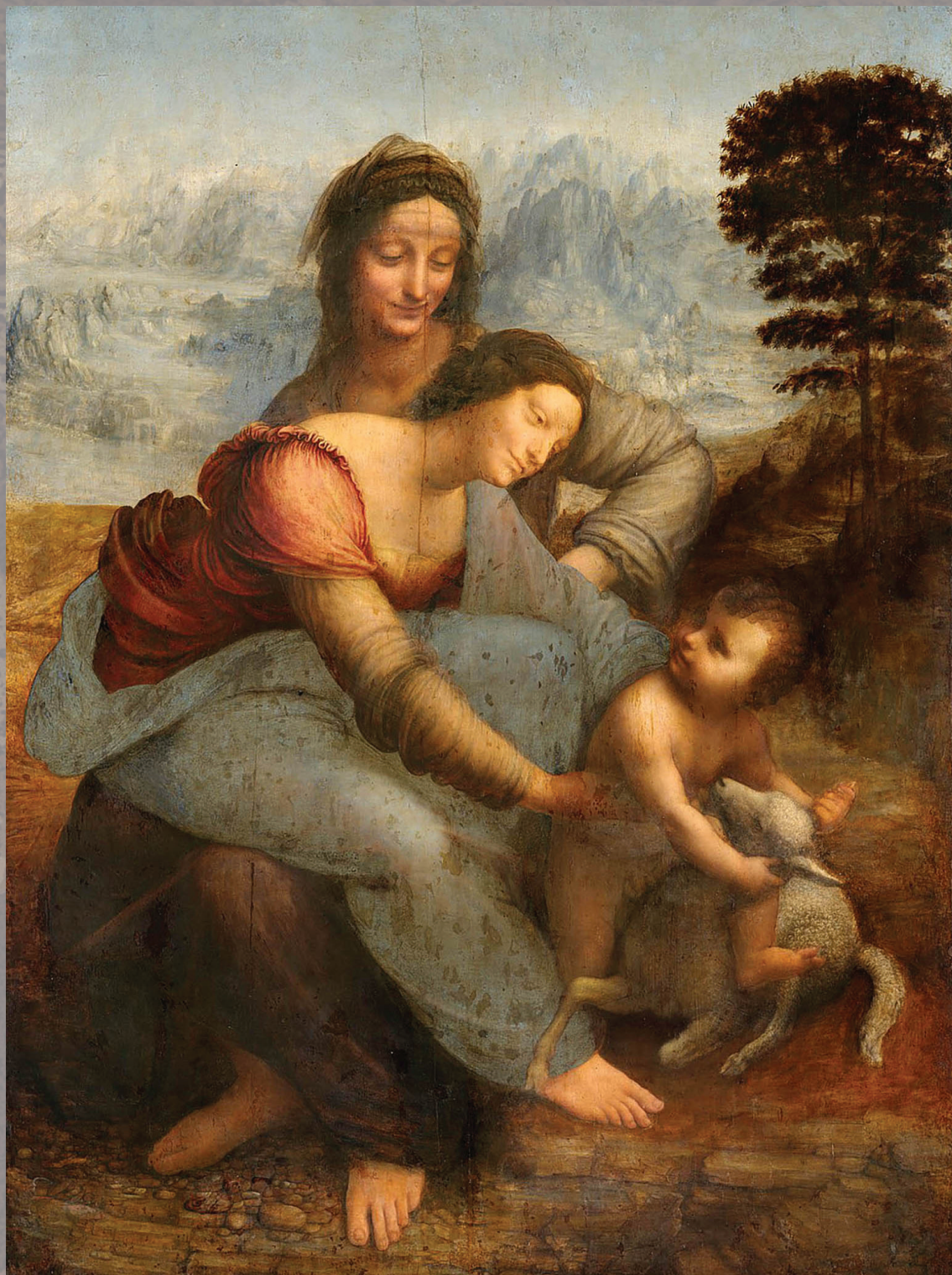
Maria met kind en Sint Anna , Leonardo da Vinci, ca. 1503

Uitgave van de Protestantse Gemeente te St.-Oedenrode, Son en Breugel