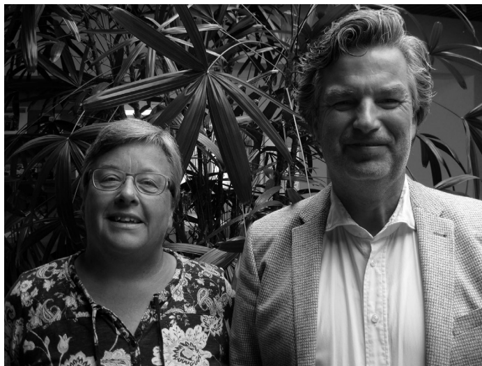
De nieuw bevestigde ambtsdragers